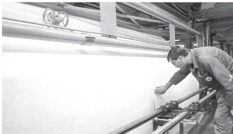
Die Produktion bei der Technische Textilien Lörrach GmbH

Die Reihe der Softwareprodukte des Weinheimer Softwarehauses für den Fachhandel wurde mit dem System SDS telecam erweitert. Die neue Software deckt den Aufgabenbereich der Präsentationskontrolle aus der Entfernung ab. Vorbei ist die Zeit, wo der Filialcontroller laufend die einzelnen Be-