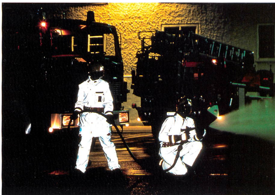
Meier / Schoeller: Kombinierte Schutzfunktionen

stiefel mit dem schnittfesten «schoeller®keprotec®» vor. Im Falle der Schnittschutzgewebe bildet ein stabiler Inox-Faden die Seele des Garnes und wird ummantelt von hochfestem Dyneema®. Mit diesem Gewebe ist Haix (D) ein Forststiefel gelungen, der die EN345 S2 mit Schnittschutz nach Klasse I bestanden hat und über sehr hohen Tragekomfort verfügt.