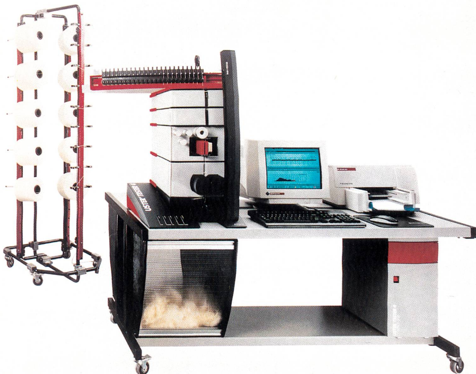
Abb. 1: USTER® TESTER 4-SX

diesem Grund stellt Zellweger Uster nun den neuen USTER® TESTER 4 vor, ein Garnleichmässigkeitsprüfgerät der nächsten Generation.