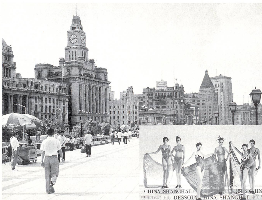
Shanghai – die Modemetropole Chinas

Eine gewagte Interpretation traditioneller Verhaltensmuster – misstönende Farbspiele, energische Farben, gegenübergestellt, gemischt mit sehr dunklen, ethnischen Tönen: Indigoblau, Kaffeebraun, Eisengrau.