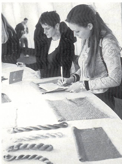
Geschäftiges Treiben an der EXPOFIL '97

«Wir haben alle unsere japanischen Kunden gesehen», unterstreicht ein Fantasiegarn-Spezialist.