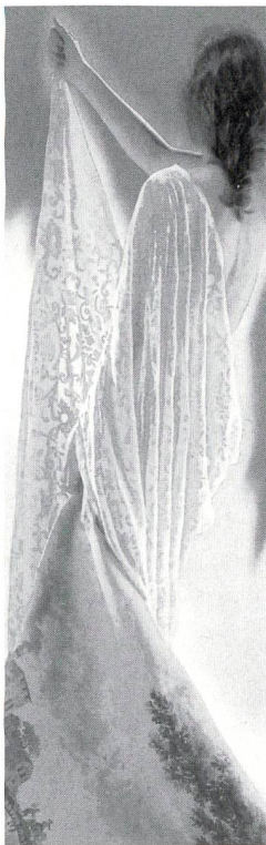
Immer böher fliegend – proposte '98

Informationen: Studio Michelangelo, Via Antonio Tantardini 8/4, I-20136 Milano, Tel.: 0039 2 832 2028, Fax: 0039 2 8940 2044