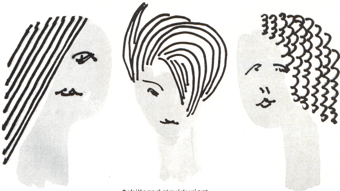
Immer haargenau technisch ausgelegt