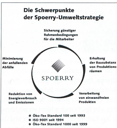
Die Schwerpunkte der Spoerry-Umweltstrategie

Weiter sind Humanökologie am Arbeitsplatz und der gänzliche Verzicht auf Kinderarbeit Bedingungen für die Zertifizierung. Die Erfüllung der Standards wird von den unabhängigen Instituten der Internationalen Gemeinschaft für Forschung und Prüfung auf dem Gebiet der Textilökologie regelmässig überprüft.