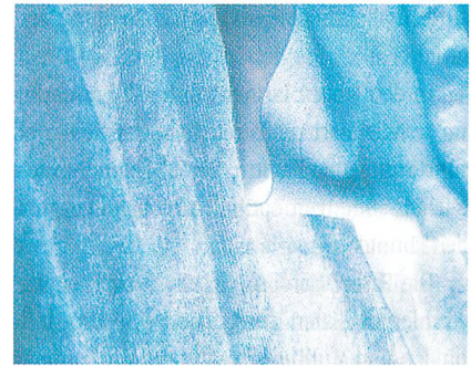
Abb. 1: Vliesstoff aus Rhovyl'As antibacterial für Matratzenabdeckungen

BIOKRYL und BIOKRYL PLUS können problemlos mit Naturfasern wie Baumwolle, Wolle, aber auch Viskose und Lyocell gemischt werden, ohne deren fühlbare Eigenschaften und Merkmale zu beeinträchtigen. Auch als Mischung für synthetische Fasern wie Polyacryl, Polyester und Polyamid können sie verwendet werden. Die Anwendungsgebiete reichen von Putz- und Wegwerftüchern, um die gegenseitige Infizierung verschiedener Flächen zu verhindern, bis zum Einsatz als Filter, um die in der Luft schwebenden Bakterien und Pilze zu reduzieren. Weiterhin tragen die Fasern dazu bei, die auf feuchten Stoffen entstehenden Gerüche zu