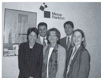
Messe Frankfurt, Offizielle Vertretung Schweiz/Liechtenstein, Postfach, 4002 Basel, Tel.: 061 316 59 99, Fax: 061 316 59 98

Die Heimtextil Asia Asiaflor (International Trade Fair for Home Textiles, Floor Coverings and Interior Furnishings) ist speziell darauf ausgelegt, Angebot und Nachfrage an einem Ort zusammenzuführen. Die dynamische junge Generation der asiatischen Architekten und Innenausstatter sowie der Gross- und Einzelhändler ergreift jede Gelegenheit, führende neue Produkte, Technologien und Designrends aufzuspüren; und diese Messe ermöglicht den optimalen Kontakt zwischen beiden Seiten der Raumausstattungsindustrie. Die Debütveranstaltung findet vom 3. bis 5. November 1999 im Hong Kong Convention & Exhibition Centre statt.