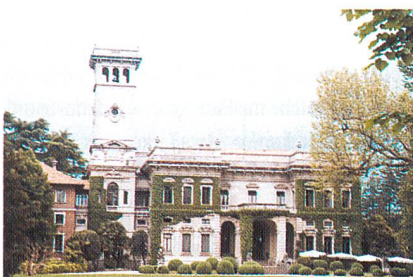
Der Veranstaltungsort der proposte '99 – Villa Erba

Die siebte Edition PROPOSTE, die Messe der europäischen Möbelstoffe- und Gardinenhersteller, die vom Consorzio Promozione Tendaggio Italiano und Ascontex organisiert wurde, hat einen Rekord an Besuchern erzielt. 8088 Fachleute kamen vom 5. bis 7. Mai 1999 aus allen fünf Kontinenten zur Villa Erba, wobei eine Steigerung von 23% gegenüber PROPOSTE '98 zu verzeichnen war. Die 4808 ausländischen Gäste kamen aus 64 Ländern. Dieser Erfolg unterstreicht die Fähigkeit der PROPOSTE-Messe, den Bedürfnissen des Marktes nachzukommen und alle, von den Fachleuten gewünschten Anforderungen erfüllen zu können. Dazu gehört beispielsweise die Auswahl der Waren ausschließlich aus den Bereichen Heimtextilien und Gardinen.