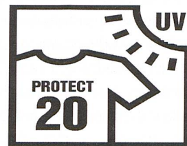
Kennzeichnung des funktionellen UV-Schutzes