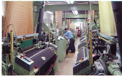
Websaal: Jacquard-Weberei in Hausen im Jahr 2000

Traditionellerweise führt Weisbrod-Zürrier aufwendige reinseidene Fahnen- und Trachtenstoffe. Auch diese Sparte wird seit Generationen sorgfältig gepflegt. Beinahe jede seidige Ver-