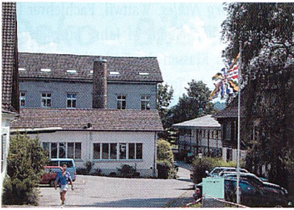
Fabrik- und Bürogebäude im Jahr 2000, Ansicht von Norden