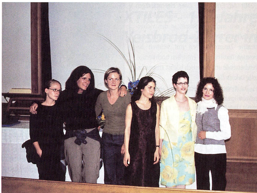
Die ausgezeichneten Studentinnen