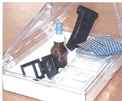
Kleines "Prüflabor" für den Aussendienst

nente Hydrophilausrüstung beinhaltet und von der Unterwäsche-Qualität bis zum Microfaser-Fleece zum Einsatz kommt. Die Mehrkosten stehen in vernünftigem Verhältnis. Wir rechnen mit 3 bis maximal 7 % Preisauflschlag," be-