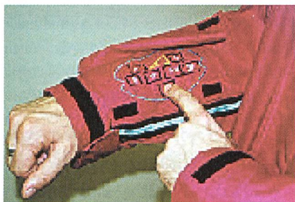
Abb. 1: Die Tastatur am Arm

"Die "Soft-Switch"-Technologie ist faserunabhängig und kann theoretisch in Verbindung mit jeder beliebigen Textilkonstruktion eingesetzt werden", so Jones. Die Geräte sind waschbar, dauerhaft und zeigen ähnliche Eigenschaften wie konventionelle Textilien. "Die Technologie ist nicht nur für Bekleidungstextilien vorgesehen. Soft-Schalter können auch in Wände, Stühle, Fussbodenbeläge - also in alles was weich ist - eingebaut werden," meint Steven