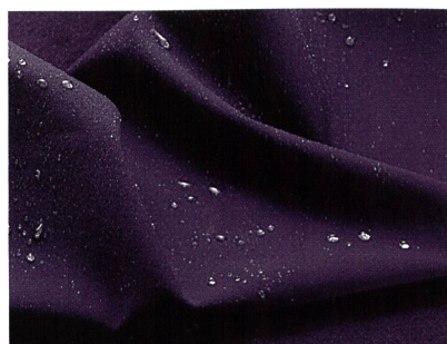
Abb. 2: Deodry Fabrics

Das neue System ist bei verschiedenen hochelastischen und sehr leichten Schoeller-Geweben bereits integriert. Es wurde ursprünglich für intensive Outdooraktivitäten entwickelt. Die angenehme und 3-fach effiziente Wirkung kann aber ebenso für den Arbeits-, Freizeit- oder modischen Bereich genutzt werden. Denn der Körper bleibt nicht nur bei körperlichen Anstrengungen, sondern auch bei heissen Temperaturen, hoher Luftfeuchtigkeit oder einem überraschenden Regenschauer von innen wie von aussen spürbar trocken und die sonst beim Schwitzen entstehenden Geruchsbakterien fallen erst gar nicht an.