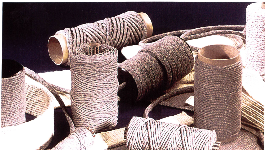
Wärmeisolationsfäden von Ferlam Technologies

rüstet (Kupfer, Messing, Inconel, Chromnickel usw.). Danach werden die Fasern nach klas-