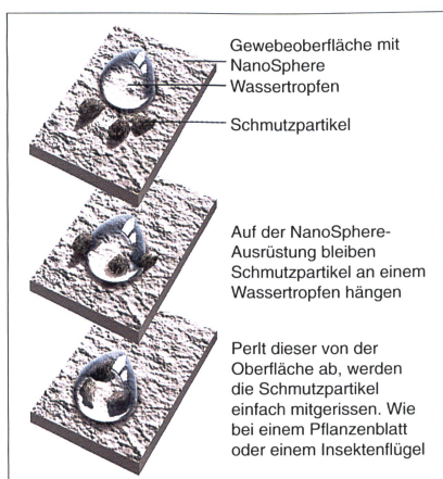
Abb. 1: Die Funktion des Nano-Finish

Parallel zu dieser Strukturbildung entsteht durch gelbildende Zusätze das Porensystem einer Membrane. Auf dieser dreidimensionalen Oberflächenstruktur kann sich Schmutz nicht festsetzen und Wasser wird abgewiesen. Das in der Schweiz entwickelte Verfahren entspricht