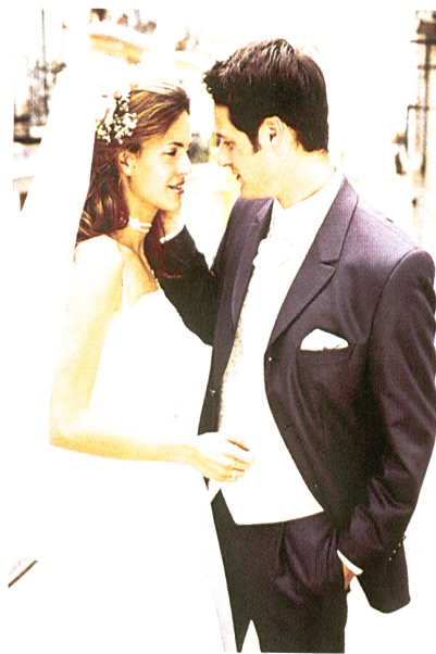
Modischer Einreiber aus der Frühjahrs/Sommerkollektion 2001 der Marke Wilvorst

Bugatti ist neben Pikeur die stärkste Marke der Gruppe Brinkmann, und ist auch in der Schweiz mit einer Vertretung in Zürich ein star-