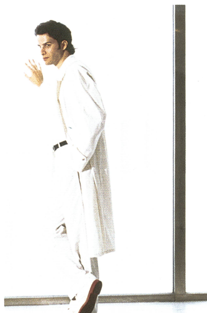
Eres by Blicker: Neo-klassischer Raglan Staubmantel

Alle Marken und Linien werden von Modellmachern und von einem Produktionsstab mit Hilfe von modernster Technik entwickelt und hergestellt. Es sind dies: computerisierte Schnittbilder, vollautomatischer Cutterzuschnitt, Fixierpresse mit automatischem Stapler, das Eton-Transportsystem, sowie ein computerge-