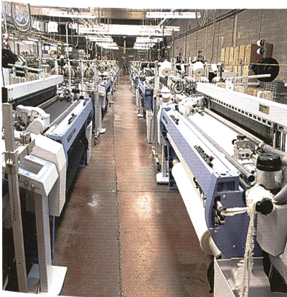
Innert kürzester Zeit hat sich die Greiferwebmaschine G 6300 auch für die Produktion von hochwertigen Wollgeweben ausgezeichnet bewährt.

nach dem Webmaschinenkauf vorbildlich. Der Service beschränkt sich nicht allein auf die Inbetriebnahme der Maschinen, sondern stellt sicher, dass die Maschinen ihren Dienst auch nach dem Kauf ein Leben lang zur vollen Zufriedenheit versehen. Auch das reichhaltige Know-how rund um das Weben steht den Kunden jederzeit zur Verfügung und umfasst: