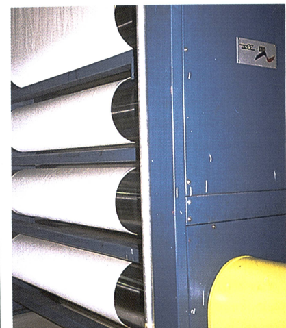
BEN-CORD - Zugwerk

Warenbahnführungsgeräte vom Typ OE (optisch elektrisch) ersetzen wartungsaufwändige