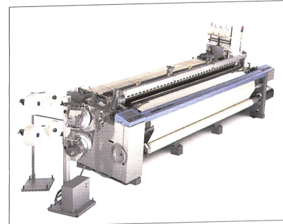
Die Luftdüsenwebmaschine L5300 erbringt Höchstleistung bei der Produktion von Frottier- und Standardgeweben. Sinnvolle Elektronik, verbunden mit kompakter Bauweise, verleihen ihr überragende Produktivität auf kleinstem Raum.