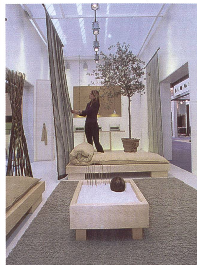
Bettwaren, Bettwäsche und Tischwäsche

Die Begriffe Klarheit, Verständlichkeit und Authentizität stehen für die vierte Strömung. Hier wird der Hedonismus der vergangenen Jahre zugunsten einer neuen Innerlichkeit aufge-