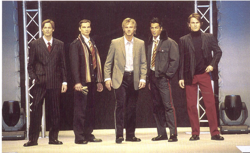
Trend on Stage 1

violett- bis bordeauxfarbenen Anzügen greifen, frech mit gleichtonigen Hemden und Krawatten kombiniert. Rockig anmutend sind Kreationen aus schwarzem Nappaleder von Bruno Banani. Joop wagte sich derweil mit einem ferrariroten Samtanzug auf den Laufsteg. Körpernah und elegant geschnitten zeichnen sie sich durch markante Details aus. So zeigte Tziacco Modelle mit doppelten Reissverschluss-Brusttaschen oder Schliesskanten mit Druckknöpfen. Anzüge mit kurzen Taillenjacken setzte Cinque in Szene, während Bugatti mit Schulterpassen liebäugelte. Wichtig in allen Kollektionen ist die Travellerausführung mit Handy-, Geldbörsen- und Passtaschen. Ansonsten zeichnen sich die Qualitäten durch viele Mischungen, wie Baumwolle aber auch Wolle mit Microfaser, aus. Wieder in den Vordergrund rückt der Denim.