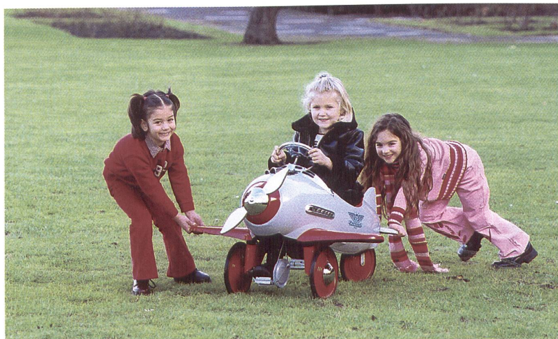
Kinder- und Jugendmode in Köln

ACHTUNG SVT-Kurs Nr. 1 Verschoben auf Freitag, 21. Juni 2002