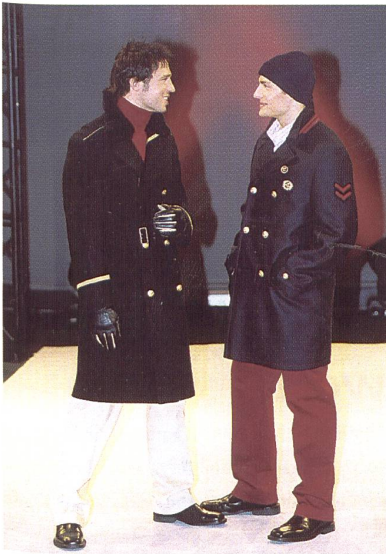
Trend on Stage 2

überlassen. Auf der einen Seite setzen sich die dekorierten bis supergeschmückten Modelle in Szene, auf der anderen Seite die kunstvoll verdeckten bis superantiken Ausführungen. Goldspritzungen, Überfärber, Spitzenapplikationen, bunte Steine, Glitzerbänder, Pailletten bis hin zu Dekorbildern à la Glanzbilder schmücken die Einen; die Anderen fühlen sich mit künstlichen Schlammgespritzern, Knautschfalten, Rissen, öligen Farbspritzern und teilweise sogar extra schiefen Nähten wohl. Modellmässig zeigt Mustang taillierte Jeansblazer mit unterschiedlichen Taschenlösungen, Jeanskleider mit Puffärmeln, gejeante kurze Cordmäntel mit Gürtel und gesmoke Blusen; Swear präsentiert einen Mantel mit Schlaufenvolants am Schalkragen; Dickies lanciert biesengeschnürte Gesässstaschen; Fubu die Workerjeans mit Muhammed Ali Konterfei; Caterpillar schliesslich propagiert Jeanshemden mit Kettelnähten. Indian Rose zeigt neben einer sehr phantasievollen Kollektion Jeans mit Ornamentdrucken sowie Kunstwerken von alten Meistern.