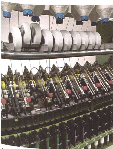
Amsler Textile Effect Systems