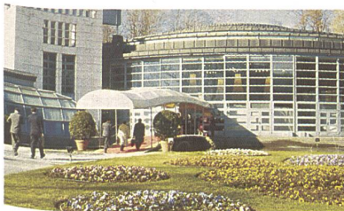
Villa Erba, Cernobbio

Die im Frühjahr stattfindende FILO, eine Messe für Garne, Fasern, Design und Veredlung von Geweben und Maschenwaren, ist in der Villa Erba in einer ausgeglichenen und von Bewusstsein gekennzeichneten Atmosphäre zu Ende gegangen. Ausgeglichenheit, begründet durch das Engagement der Aussteller und die von ihnen verbreitete Stimmung. All dies hat zum Erfolg geführt, denn die Besucher in der Villa Erba waren ein fachkundliches Publikum, und die geknüpften Kontakte, nach Aussage der Aussteller, positiv und produktiv, obwohl, wie vorausgesehen, weniger Besucher eingetroffen waren; 13,5 % Besucher aus dem Ausland, 16,9 % aus dem Inland, insgesamt – 15,2 % weniger.