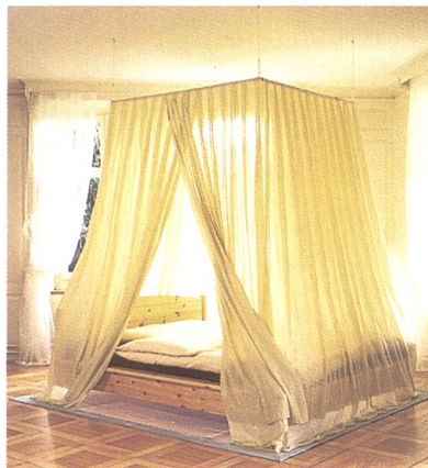
Swiss Shield Baldachin

Das Metall-Filament wird spiralförmig eingesponnen und kommt in bestimmten Abständen an die Oberfläche. In diesem Spinnverfah-