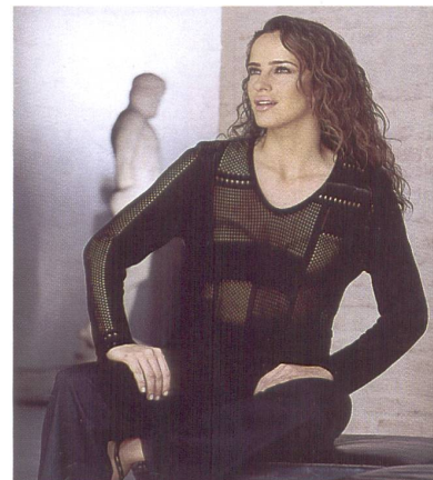
Carlo Colucci Donna

Nicht ganz einig sind sich die Designer über die Jackenformen. Manche schicken wieder den Gehrock ins Rennen. Andere befinden diese