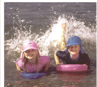
Titanoxid fängt Sonnenstrahlen ab

Das Textilforschungsinstitut Hohenstein hat den neuen UV-Standard 801 eingeführt, in dem gerade die erschwerenden Bedingungen unter Nässe und Dehnung berücksichtigt werden. Ultramid BS416N wurde vom Institut nach UV-Standard 801 ein Sonnenschutzfaktor von über 60 bescheinigt, unabhängig von Feuchte und Dehnung.