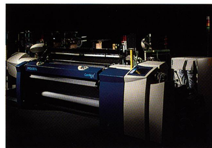
Die neue Greiferwebmaschine GamMax von Picanol

Die Free-Flight-Version der GamMax wurde insbesondere für das Herstellen feiner Filamentgewebe entwickelt. Beim Free-Flight-Konzept wird das Greiferband nicht mehr mit Haken geführt, deswegen kann das Garn auch nicht mehr von den Haken beschädigt werden, die in die Kette eintauchen. Die GamMax-FF eignet sich insbesondere für die Produktion von Futterstoffen,