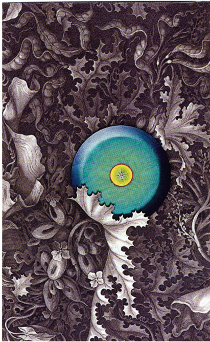
Computergestaltetes Bild «Zipelius» 60 x 120 cm. Design Jennifer Lim (Bild Internet)

stellung von Motiven zu erobern. Die Nachfrage nach neuen inkjetspezifischen Motiven ist gross. Der Studienbereich Textildesign der HGKL nutzt schon seit Langem Informatik als Gestaltungs- und Unterrichtsmedium. Die Textilabteilung verfügt über eine ausserordentliche Informatik-Infrastruktur sowie über kompetente Dozierende. Dies hat zur Folge, dass die Studierenden nicht mehr die üblichen «Anfänger Effektbilder» herstellen, sondern die Eigenschaften des Computers und der diversen Software fachgerecht einsetzen, um interessante, gestalterische und technische Lösungen zu finden.