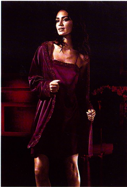
Nachtwäsche von Triumph aus Trevira Micro