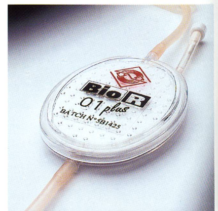
Abb. 1: Celanex PBT 2008 als Meltblown-Vliesstoff für die Blutfiltration

Neben dem vorgestellten Typ Fortron PPS 0203HS hat Ticona einen weiteren Fortron-Typen entwickelt, der speziell für den Healthcare-