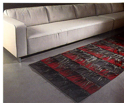
Caura cotschna aus der Kollektion «+plus»

Nach mehrjähriger Entwicklungszeit kann Ruckstuhl jetzt die neue Qualität RollerTile sowohl als Applikation für den Doppelboden wie auch als selbstliegende Fliese anbieten. RollerTile gehört zu den schwersten am Markt erhältlichen Qualitäten. Basierend auf der schon im Ruckstuhl-Sortiment vorhandenen Qualität Rollerwool wurde das Einsatzgewicht der Wollmischung auf 1'600 g/m 2 erhöht und zusätzlich die Dichte verstärkt. Die Zusammensetzung des Polmaterials wurde in der bewährten Mischung aus 80 % reiner Schurwolle aus ver-