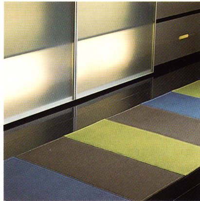
Die neue Filzqualität Fetro color

Bei «Rep» handelt es sich um einen stuhllongeeigneten Rips aus 60 % Wolle, 20 % Haargarn und 20 % Polyamid, mit dem man bei Ruckstuhl an die Verkaufserfolge schon vorhandener Haargarn-Qualitäten im Sortiment