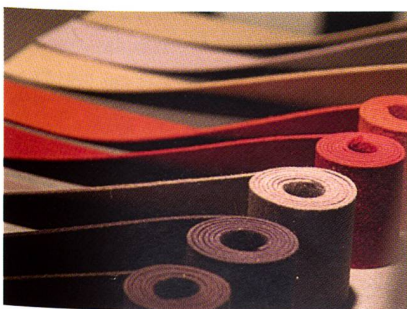
Die neuen Filzeinfassungen von Ruckstuhl

Ruckstuhl-Teppichböden sind als Basismaterial in der Innenarchitektur konzipiert. Architekten bezeichnen sie auch als Trägermaterial, das heisst, der Teppich muss sich bezüglich Texturen und Farben durch Selbstverständnis auszeichnen, damit er die verschiedenen anderen Strukturen und Farben von Architektur und Mobiliar harmonisch erträgt und auch deren Variation zulässt. Vor diesem Hintergrund wurden die beiden neuen Qualitäten «Loft» und