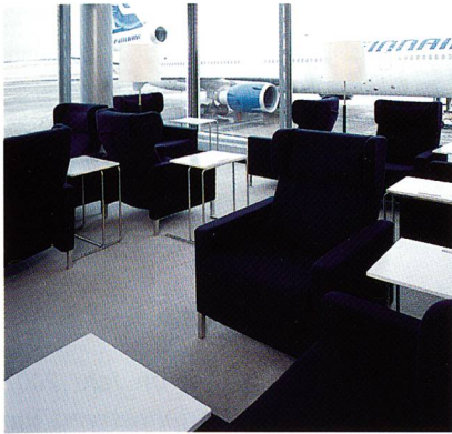
Finnair-Lounge in Helsinki

schiedenen Provenienzen und 20 % Polyamid belassen. Zusammen mit dem neuentwickelten Rücken aus speziellem Siedebitumen ergibt sich ein Gesamtgewicht von 4600 g/m 2 . RollerTile ist ein in jeder Hinsicht objektgeeignetes, planliegendes und den strengen Werten der neuen Euronorm entsprechendes Produkt. Anforderungen der Dimensionsstabilität werden ebenso erfüllt wie die B1- und Leitfähigkeitsnorm. Das spezielle Beschichtungssystem garantiert einen hohen Belastungsgrad selbst bei Einwirkung höherer Temperaturen, und die Alterungstests zeigen ein dauerhaftes und stabiles Liegeverhalten. RollerTile ist in 20 ausgesuchten Farben erhältlich, wovon die beiden erfolgreichsten Farben direkt ab Lager lieferbar sind. Sonderfarben sind natürlich ohne Aufpreis möglich.