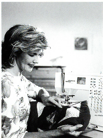
Bernina virtuosa 155 «my choice»