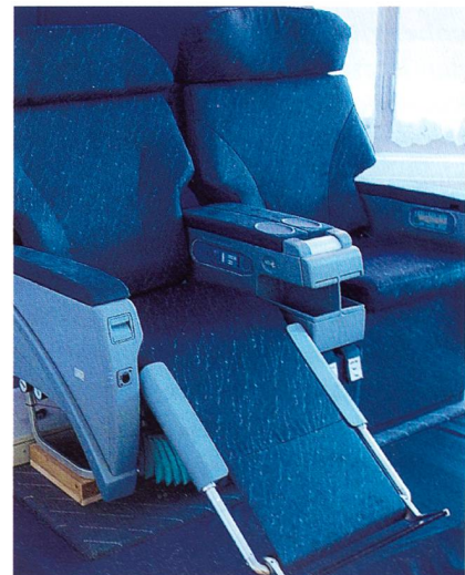
Minimales Gewicht, höchster Komfort dank Pneumatik – der Prototyp eines Zafu-Sitzes