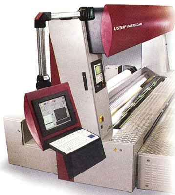
USTER® FABRISCAN für Denim

Das System soll auch komplexe Gewebearbeiten und farbige Muster zuverlässig inspizieren können. Die Größe der Fehler, bei denen ein Alarm ausgelöst werden soll, lässt sich programmieren. Eine spezielle Vorrichtung kompensiert die Vibrationen, die von der Webmaschine kommen, und ermöglicht ein scharfes Abbild des Gewebes. Es gibt keine bewegten Kameras und die Bildauflösung liegt bei 600 dpi. Im Ergebnis entsteht eine Fehlerlandkarte, die statistisch ausgewertet wird. Dieser Fehlerreport kann für die Weiterverarbeitung des Gewebewickels genutzt werden.