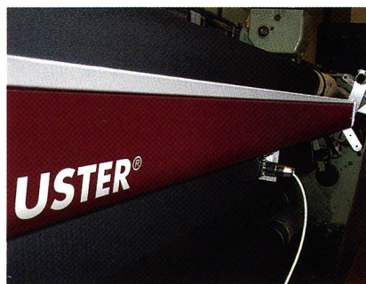
USTER® FABRISCAN ON-LOOM

Der FABRISCAN kann nun auch für die Kontrolle von Denimgeweben eingesetzt werden. Es lässt sich im On- oder Offline-Betrieb arbeiten. Auch bei diesem System wird der Fehlerbericht für die Weiterverarbeitung statistisch ausgewertet und dem Gewebewickler beigegeben. Gleichzeitig mit der Inspektion wird die Schussbogigkeit kontrolliert.