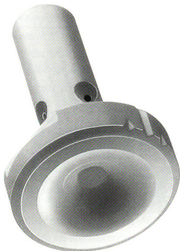
Düsenkern der A-Reihe

Lufan® 100, 200, Lufan® CS und HS dienen zum Ansaugen und zum Einfädeln von Filamentgarnen beim Spinnen, Recken, Texturieren und Spulen. Diese robusten und wirtschaft-