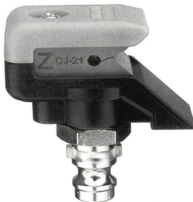
DetorqueJet DJ 21-2

lich arbeitenden Vorrichtungen können optimal an die individuellen Prozesse angepasst werden. Lufan® 100 arbeitet mit hoher Saugleistung und ist für das Einfädeln an Texturiermaschinen konzipiert. Lufan® 200 ist für langsamere Prozesse, wie Streck-Spulen, Streck-Texturieren oder Spulen bis 2'000 m/min, vorgesehen. Lufan® LC arbeitet mit einem geringen Luftverbrauch und kann für Prozesse bis 5'000 m/min, einschliesslich POY-Verarbeitung, eingesetzt werden. Lufan® HS ist für Geschwindigkeiten bis 8'000 m/min konzipiert. Die beiden letzt genannten Geräte stehen jeweils in drei Versionen für Feinheiten von 1'600 bis 10'000 dtex zur Verfügung.