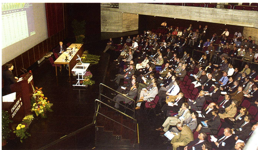
Das Auditorium zur 42. Chemiefasertagung

Aufgrund der anerkannt guten Eigenschaften im Endprodukt hat sich die Polyacrylfaser Dolan für textile Cabriovertdecke seit vielen Jahren fest etabliert. Dabei konnte der Qualitätsvorsprung kontinuierlich ausgebaut werden. Der Vortrag gab einen Überblick über die Anforderungen, die an das Endprodukt Cabriovertdeck gestellt und welche speziellen Eigenschaften dadurch der Faser abverlangt werden. Es wurde von Entwicklungsaktivitäten berichtet, deren Zielsetzung es ist, den Service und die Produktqualität für die nachfolgenden Weiterverarbei-