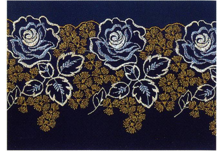
Innovatives Design für Spitzen aus Trevira Classixx von Soulis Kuebnis

Metallisierende Oberflächen, Beschichtungen, High-Tech-Garne, Matt/Glanz-Effekte, Sa-