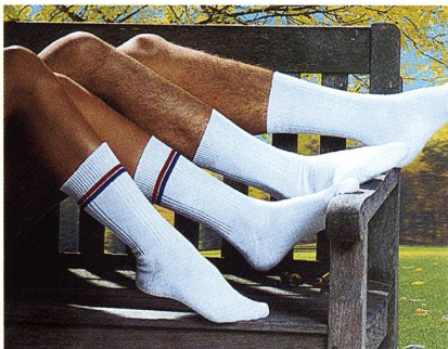
Bequem, funktional und antimikrobiell: Socken aus Trevira Bioactive

Das Spiel des Lichts, das Spiel zwischen Natur und Technik, zwischen Tradition und Modernität lassen die Farben facettenreich und neu erscheinen. Metallisch schimmernde Farben, die wie Gold, Silber oder Kupfer wirken, wech-