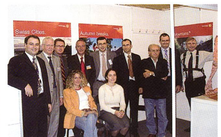
Schweizer Aussteller an der Techtextil Rossija

Die Techtextil Rossija wurde erstmalig in Kooperation zwischen Messe Frankfurt RUS und JSC Textilexpo im All-Russischen Messezentrum VVC in Moskau realisiert. «Unsere Hauptzielsetzung mit der Techtextil Rossija ist es, eine neue internationale Marketing- und