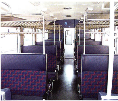
Babnwagen der SBB