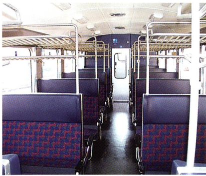
Babnwagen der SBB