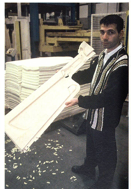
PKW-Innenverkleidung aus Flachsfasern