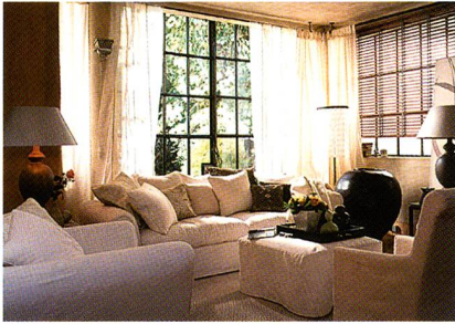
Textilien aus Securelle® im Heimtextilbereich

geschäft und in der Wohnraumausstattung bieten Securelle®-Textilien jetzt zusätzlich: