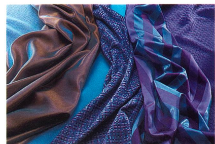
Abb. 4: Die neuen Trevira CS Entwicklungen

Die besondere Auszeichnung ging an einen Stoff, der durch die aussergewöhnliche Kombination von Garnen ein neuartiges, zeitgemässes Design schafft. Kombiniert wurde hier Chenille-