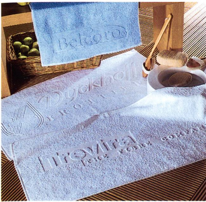
Abb. 3: «Antimicrobial und hygienic»: Handtücher aus Trevira Bioactive

ventionsmassnahmen in den Bereichen sinnvoll unterstützen, in denen besonders hohe Anforderungen an die Hygiene gestellt werden – wie z.B. in Krankenhäusern, Pflegeeinrichtungen, Altenheimen (gemäss Infektionsschutzgesetz), bei der Lebensmittelherstellung und -verarbeitung (HACCP) sowie bei der Berufskleidung von Reinigungsunternehmen (UVV).»