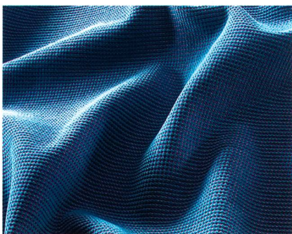
Abb. 5: Diese Gewebeentwicklung aus Trevira CS Monofilamentgarnen erhielt beim ATI-Innovationswettbewerb eine besondere Auszeichnung, Foto: Trevira

garn mit KDK-texturierterm Garn (strickttexturiert). Chenillegarne sind häufig in klassischen Stoffqualitäten zu finden. Sie haben einen plüschigen Charakter. KDK-Garne besitzen durch die Stricktextrurierung einen hohen Glanz, sie wirken eher technisch. Durch das Kombinieren dieser sehr unterschiedlichen Garne, gerade in