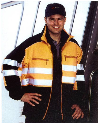
Abb. 1: «Approved by armasuisse»: workwear aus Trevira classixx, Foto: Eschler

Eschler produziert auch antimikrobielle Workwear-Materialien für den medizinischen Bereich, denn vor allem im Gesundheitswesen