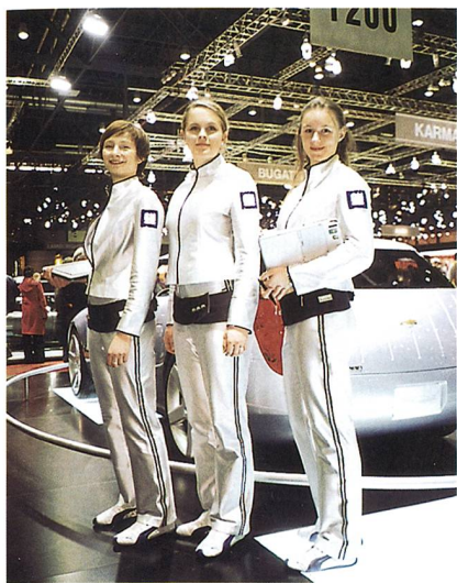
Die leuchtende Bekleidung à la General Motors

ckungen oder in Sport- und Freizeit-Outfits. Wir sind in der Lage, sowohl textile Flächen als auch Bänder sowie einzelne Fasern zum Leuchten zu bringen.»