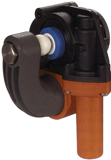
Düsengehäuse HemaJet® LB24

stoffummantelung schlaggeschützt. Mit der Ummantelung werden gleichzeitig auch die verschiedenen Düsentypen farblich gekennzeichnet und so Verwechslungen vermieden.