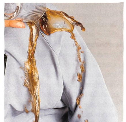
NanoSphere® lässt Wasser und Schmutz einfach abperlen

Schoeller ist seit 1998 in der Nanoforschung aktiv. Es dauerte länger als erwartet, bis das Unternehmen Textilien auf Nanometer-Ebene anbieten konnte, die gut funktionieren und bluesign®-konform (siehe auch Kasten) sind.