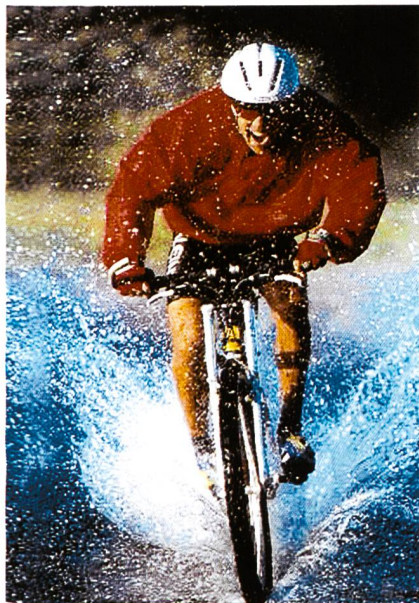
Abb. 1: Biker in action

Ganz nach dem Motto «back to the future» hat Eschler die bekannten, bewährten, geschmeidigen und bewegungselastischen Maschenstoffe aus mikrofeinem Polyesterfilamentgarn neu entwickelt und optimiert. Die neuen Qualitäten sind dank Einsatz von texturiertem Polyester-garn jetzt wesentlich elastischer, dichter (Luft-durchlässigkeit maximal 150 l/m 2 /s), bieten daher ausgezeichneten Windschutz und trotzdem hervorragende Atmungsaktivität. GameX® Compact Qualitäten in Weiss für Druck weisen