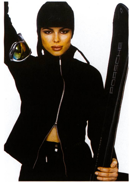
Abb. 2: Skijacke und Skibose aus E-star® 2000 Softshell-Laminat, Modell: Sportalm, Kitzbühel/A

Seit mehr als 15 Jahren besteht zwischen der Christian Eschler AG in Bühler und der italienischen T.M.F. (Di Turrini Patrizia S.N.C.) in Villafraanca di Verona eine einzigartige Partner-