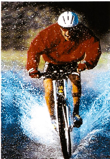
Abb. 1: Biker in action

Ganz nach dem Motto «back to the future» hat Eschler die bekannten, bewährten, geschmeidigen und bewegungselastischen Maschenstoffe aus mikrofeinem Polyesterfilamentgarn neu entwickelt und optimiert. Die neuen Qualitäten sind dank Einsatz von texturiertem Polyester-garn jetzt wesentlich elastischer, dichter (Luft-durchlässigkeit maximal 150 l/m 2 /s), bieten daher ausgezeichneten Windschutz und trotzdem hervorragende Atmungsaktivität. GameX® Compact Qualitäten in Weiss für Druck weisen