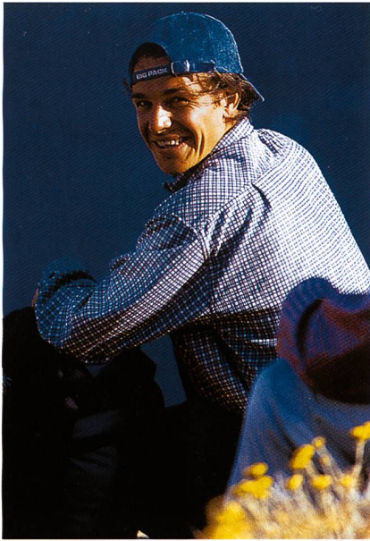
Abb. 3: Karo-Hemd aus Husky® Hemdenfleece «Bioactive»

Kombination modernster Verformungs-Technologie mit kundenspezifischen Druckdessins. Ein Messebesuch beim Erfolgs-Tandem Eschler /T.M.F. lohnte sich.