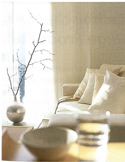
Von Baumwollgewebe über edle Seidenstoffe bis zum schweren Leinenstoff

Nun wird das erfolgreiche Programm aus Raff- und Flächenvorhängen, Lamellen und Rollos um eine Serie neuer Vertikallamellen ergänzt – von sachlich bis verspielt. Die Erweiterung der Kollektion setzt auf Formen, Linien und Effekte. Sie umfasst dabei zum einen die Weiterentwicklung von Klassikern, zum anderen Neuentwicklungen in Druck-, Häkel- und Prägetechnik. Bei den Klassikern ist neu «Erato II» in 15 Farben erhältlich: Den halbtransparenten Stoff gibt es nun auch in kräftigeren Farben sowie in zweifarbiger Ausführung. Der etwas dichtere Stoff «Pado II», bisher nur in