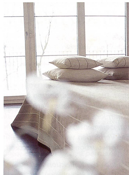
Natura-Kollektion – pflegefreundlich und lichtecht

Vorbei die Zeiten, als man mit Lamellenvorhängen unangenehme Zahnarztbesuche und langweilige Amtsstuben verband. Heute ist der einst verstaubt wirkende Fenster-, Sicht- und Blendschutz wieder salonfähig. Mit der Kollektion «systems» tritt das Langenthaler Textilunternehmen création baumann den Beweis an: Die Lamellenvorhänge bieten variantenreiche, zeitlose Lösungen rund ums Fenster – zu Hause und im Büro.