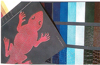
Farbkarte mit Stanzteil