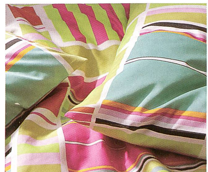
Bonjour of Switzerland

Swiss Twill Collection® heisst die junge, trendige Kollektion von Bonjour of Switzerland