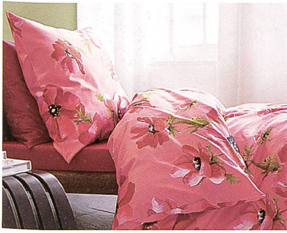
Schlossberg Textil AG

Strandtage. Inspiriert am aktuellen Retro-Style-Thema, lassen wir das «Savoir Vivre» des berühmten Küstenstreifens zwischen Cannes, Nizza und Monte Carlo aufleben.