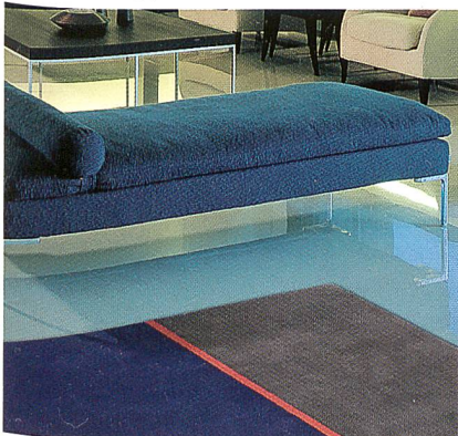
Tisca Tischhauser &amp; Co. AG

Tisca Teppiche ist ein Schweizer Familienunternehmen, das seit 60 Jahren seinen Firmensitz im Kanton Appenzell Ausserrhoden hat. Der