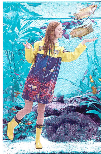
Drei-Lagenlaminat für Regenbekleidung

goldgelber Fische in blutroter Korallenlandschaft sorgt diese Wetterschutz-Ware für Farbe im Regengrau und gute Laune beim Betrachter. Unterstützt wird dies vom Sonnengelb des Materials an den Ärmeln und auf der Mantelrückseite. Das hierfür verwendete Laminat wurde speziell für den Einsatz in Sportbekleidung hergestellt und kombiniert drei funktionelle Schichten: eine Kettenwirkware mit einer gezielt atmungswirksamen Musterung auf der Aussen-seite, eine atmungsaktive, wasserabweisende Membran darunter und eine leichte Meshware zu deren Schutz auf der Innenseite. Die Wirkwaren wurden jeweils auf einer HKS 3-M hergestellt – mit einer EBA 2-Step Modifikation für die Deckware. Die Verbindung des Textilmaterials mit der mikroporösen Membran erfolgte durch das Point-in-Point-Verfahren der Firma