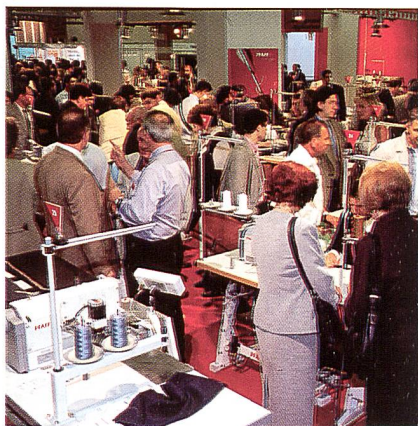
Messestand eines Nähmaschinenherstellers

Zur IMB werden mehr als 700 Unternehmen aus rund 45 Ländern erwartet, davon fast 70 % aus dem Ausland. Damit ist die IMB die weltweit grösste und bedeutendste Kommunikations- und Business-Plattform der beteiligten Branchen. Köln, im Zentrum der Hightech-Grossregion Europa gelegen, ist die optimale Basis für das multilaterale Geschäft, für den branchenin-