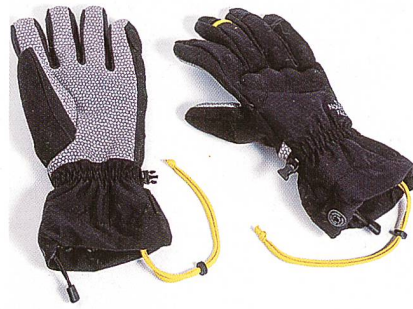
Handschuhe von north face

«So eine positive Messe habe ich in den vielen Jahren, die ich im Geschäft bin, noch nie erlebt. Ich fühle mich hier sehr wohl, konnte mir letztes Jahr als Gast von der ispo vision Eindrücke holen, und ich habe die Entscheidung, auszustellen, bewusst getroffen. Diese Rechnung ist voll aufgegangen. Die ispo vision ist eine sehr