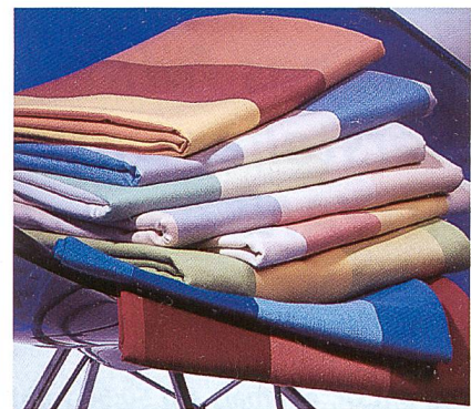
Abb. 3: Zusatzfunktion durch antibakterielle Eigenschaft, Foto: Ado

In der Regel werden an Medizin- und Hygienetextilien sehr hohe und vielfältige Anforderungen bezüglich Funktion, Körperverträglichkeit und Komfort gestellt, die über den gesamten Lebenszyklus des Textils garantiert werden müssen. Spezielle Trevira Polyesterfasern und -filamentgarne leisten auch hier einen wichtigen Beitrag. Ein spezielles Gebiet der Medizintexti-