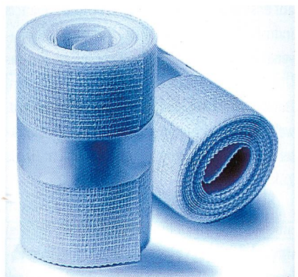
Abb. 4: Thermocast-Bandage mit hochelastischem Trevira Filamentgarn, Foto: Karl Otto Braun KG

Permanent schwer entflammare Fasern und Garne sind die Basis für hochwertige Objekttextilien (Trevira CS). Trevira Bioactive Typen erweitern die Funktionspalette und schützen wirksam gegen Mikroorganismen. Trevira Micro Qualitäten, superfein und weich, Trevira Wollmischungen (Trevira Perform), feinfädige und wertig, sind unerlässlich in der Kollektion. Trevira Xpand Qualitäten sorgen für den nötigen Komfort mit Funktion und stehen für eine neue Stretchgeneration. Feinstfädige, kationische Filamente sind wegen ihrer färberischen Vorteile universell einsetzbar.