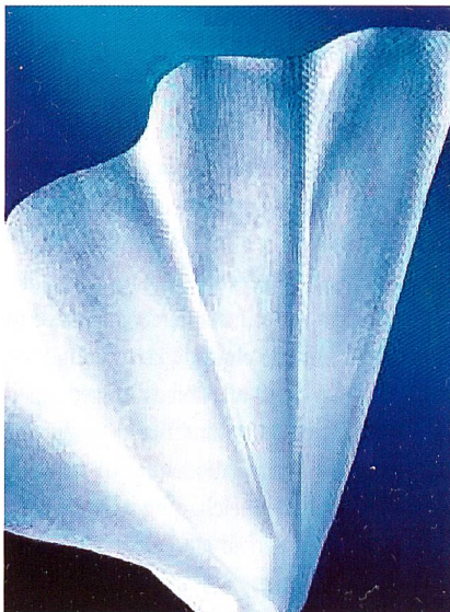
sawatex ® Daily Wipe, Foto: Sandler AG, Quelle Internet

Weiterhin wurden erstmals sawabond ® Vliesstoffe mit extrem hoher Dehnfähigkeit vorgestellt. Interessant hierbei sind der weiche Griff und die angenehme Haptik. Eine Laminierung mit elastischen Folien und/oder elastischen Vliesstoffen wird ebenso angeboten. Soft und supersoft sawabond ® Materialien werden durch