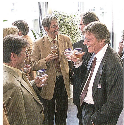
Angeregte Diskussionen beim Apéro

Alle werden in Globo mit einem kräftigen Applaus bestätigt, respektive neu gewählt.