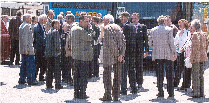
Besammlung für die Betriebsbesichtigungen