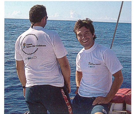
Coolmax® T-Shirts: Vor- und Rückansicht

Bereits im Frühjahr vorgestellt, hat Coolmax® freshFXTM inzwischen seinen Weg in die Sortimente zweier führender europäischer Textilunternehmen gefunden, die in diesem Sommer aktuell präsentiert werden.