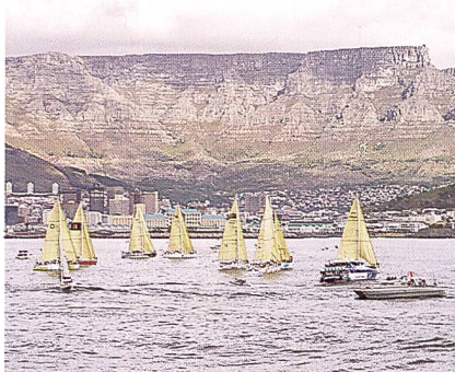
Global Challenge Rennyachten beim Verlassen Kapstadts für die heiße Phase des Rennens