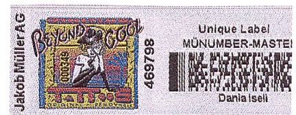
Abb. 1: Etikett mit verschiedenen Nummern- und Strichcodes

mern, mit zufälligen und alphanumerischen Kennzeichnungen oder mit Strichcodes können einfach und kostengünstig hergestellt werden (Abb. 1). Die Kombination der verschiedenen Möglichkeiten erlaubt die Produktion absolut fälschungssicherer Etiketten. Zusätzlich zur ihrer Funktion als Sicherung gegen Fälschungen,