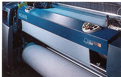
Abb. 1: OMNIplus 800 4 P 190 Luftdüsenwebmaschine