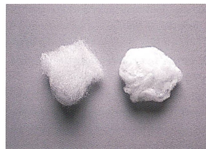
PPS-Stapelfasern 2,2 dtex / 60 mm (rechts) und 7,7 dtex / 80 mm (links)

Kermel hat eine neue Generation von textilen Aussenmaterial entwickelt, die modernsten Anforderungen im Hinblick auf Schutzzeigenschaften, Bequemlichkeit und Beständigkeit